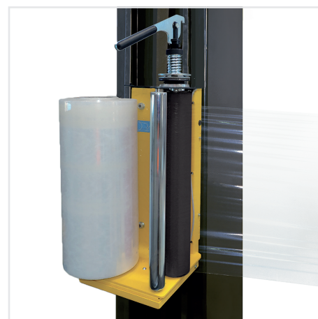
Folienschlitten mit mechanischer Bremse