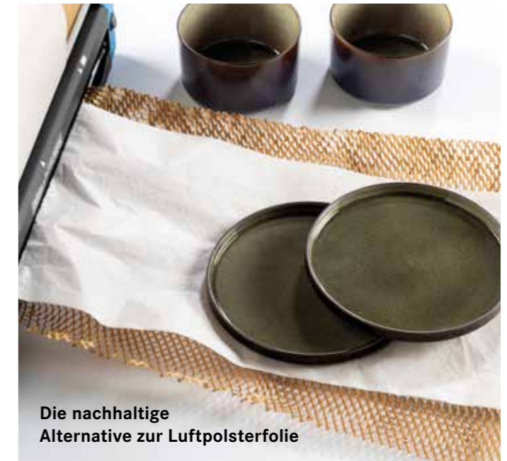
Die nachhaltige Alternative zur Luftpolsterfolie

Ohne Halterung für Seidenpapier: Format 62 x 24 x 30,5 cm (B x T x H), Gewicht 21,4 kg