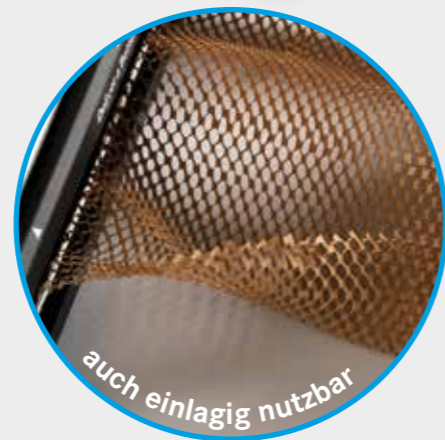
auch einlagig nutzbar