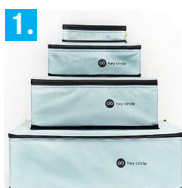
1. Location de boîtes ou sacs

Nous mettons hey circle à votre disposition dans un système de location. Ainsi, vous n'avez pas à payer de frais d'acquisition élevés. Et vous économisez des cartons et du ruban adhésif.