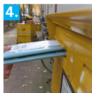
4. Retour facile via la boîte aux lettres