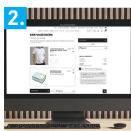
2. Offre réutilisable dans la boutique en ligne