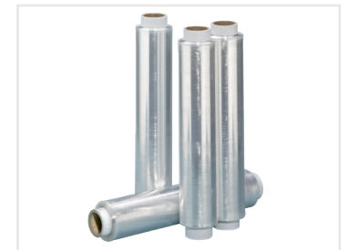
Die recycelte ProfiStretch Handstretchfolie