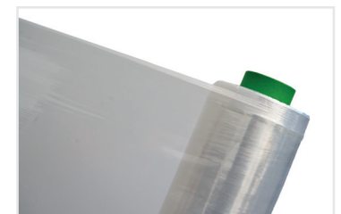
ProfiStretch 15 HCP R