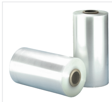
Die recycelte ProfiStretch Maschinenstretchfolie