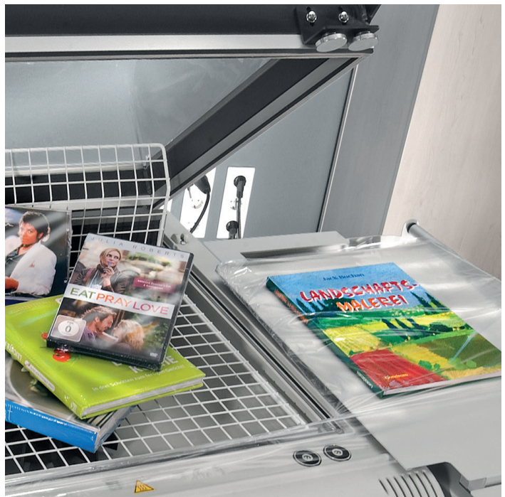
ProfiThen Feinschrumpffolie, diverse Anwendungen.