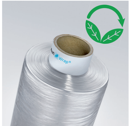
ProfiWrap 6 HC

Als Mitglied der Initiative ProStretch garantieren wir die Einhaltung von Breite, Stärke, Länge, Netto-Foliengewicht und Rollengewicht in den handelsüblichen Maßeinheiten und kennzeichnen jede Verpackungseinheit. Für den Einsatz unserer Handstretchfolien zur optimalen Ladeeinheitensicherung berücksichtigen Sie bitte die aktuelle Handlungsempfehlung von ProStretch.